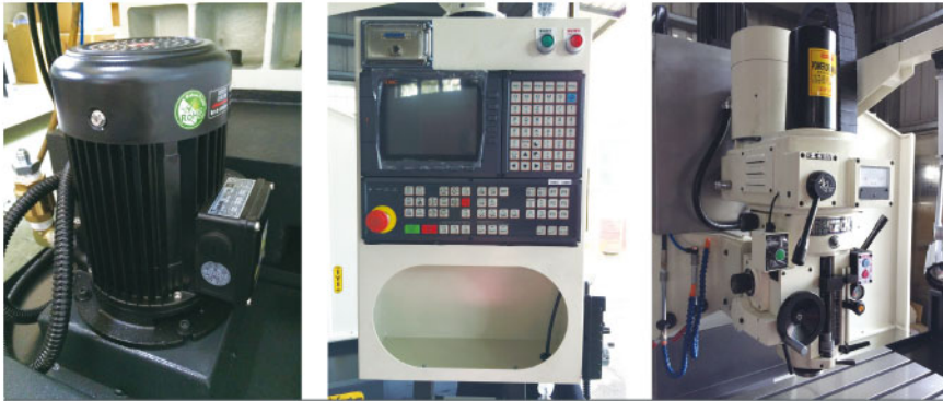
冷卻泵浦 Coolant pump 操控面板 Control panel 主軸頭 Spindle head